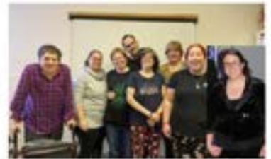
Voici les représentants du comité membres de l'Association les Amis.

L'association les consulte sur divers sujets afin de bien répondre aux besoins des membres. Le comité est supporté par un parent bénévole et un employé de la permanence.